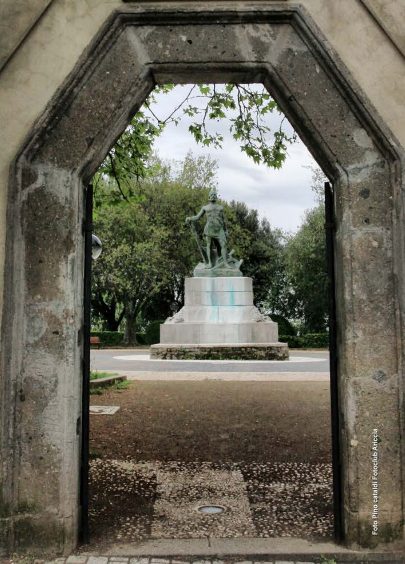
Giardini pubblici di Ariccia