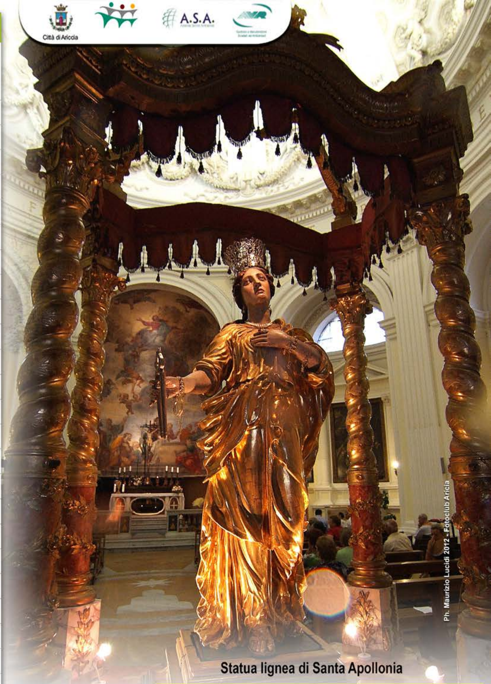
Statua lignea di Santa Apollonia