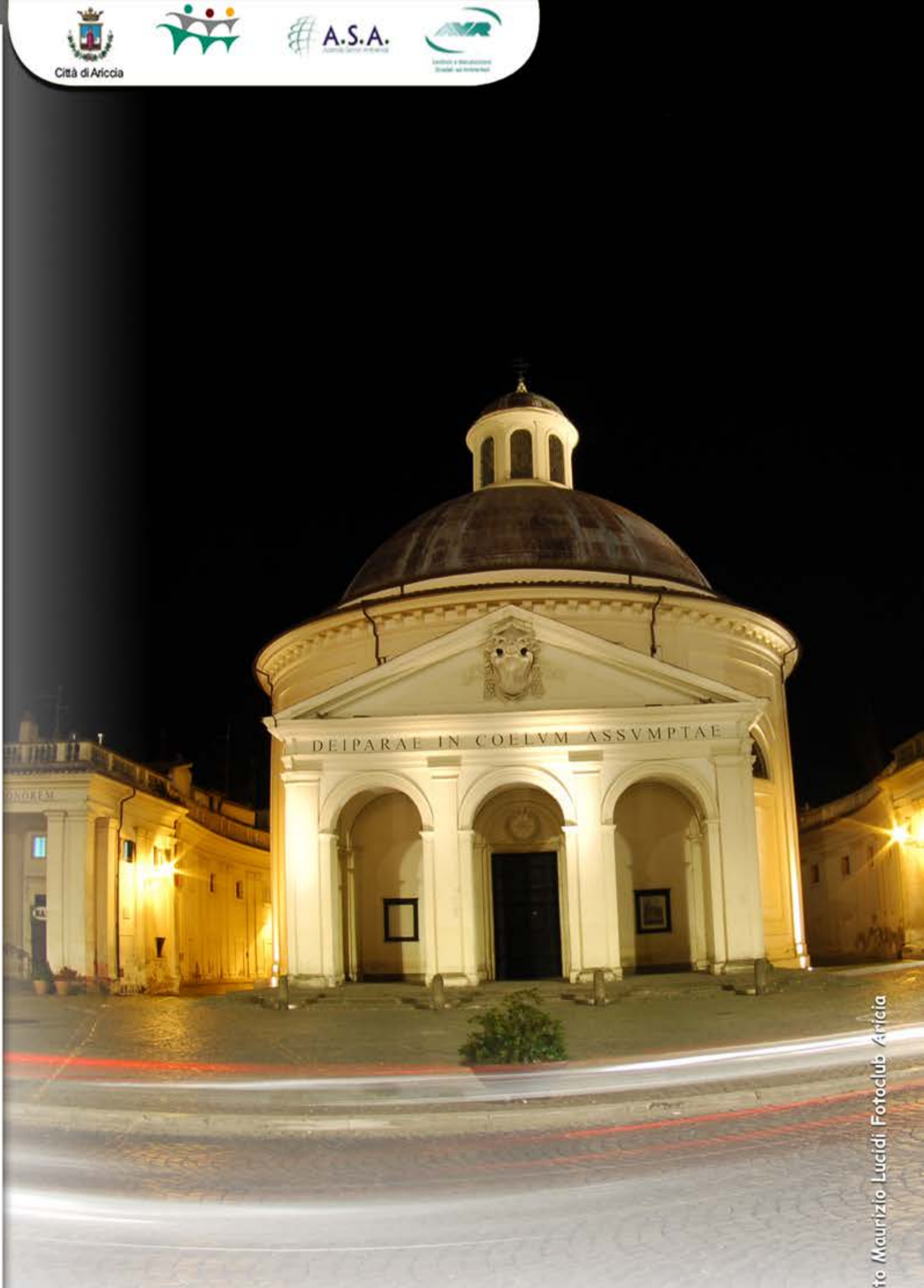
Chiesa dell'Assunta, Ariccia