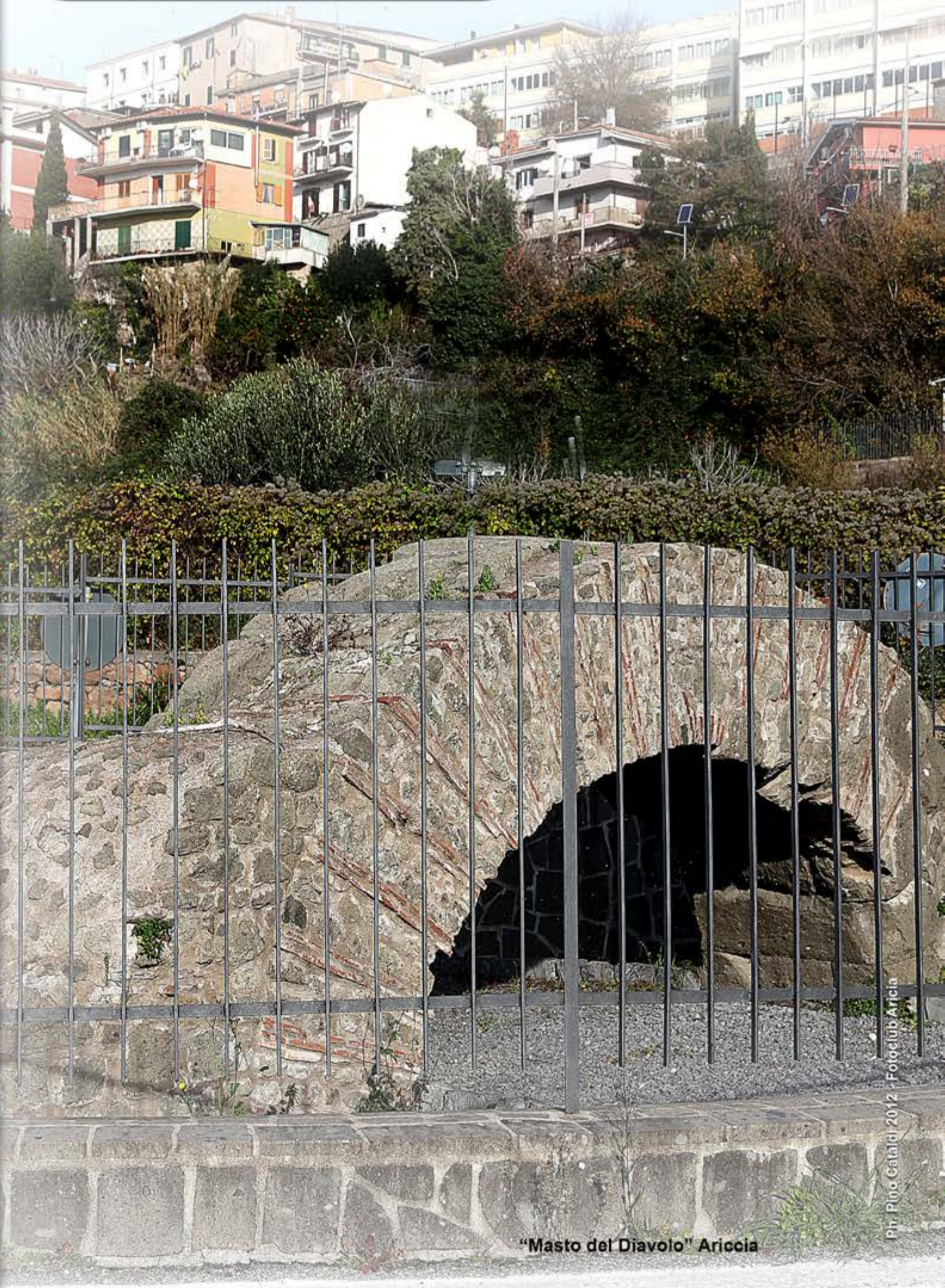
"Masto del Diavolo" Ariccia