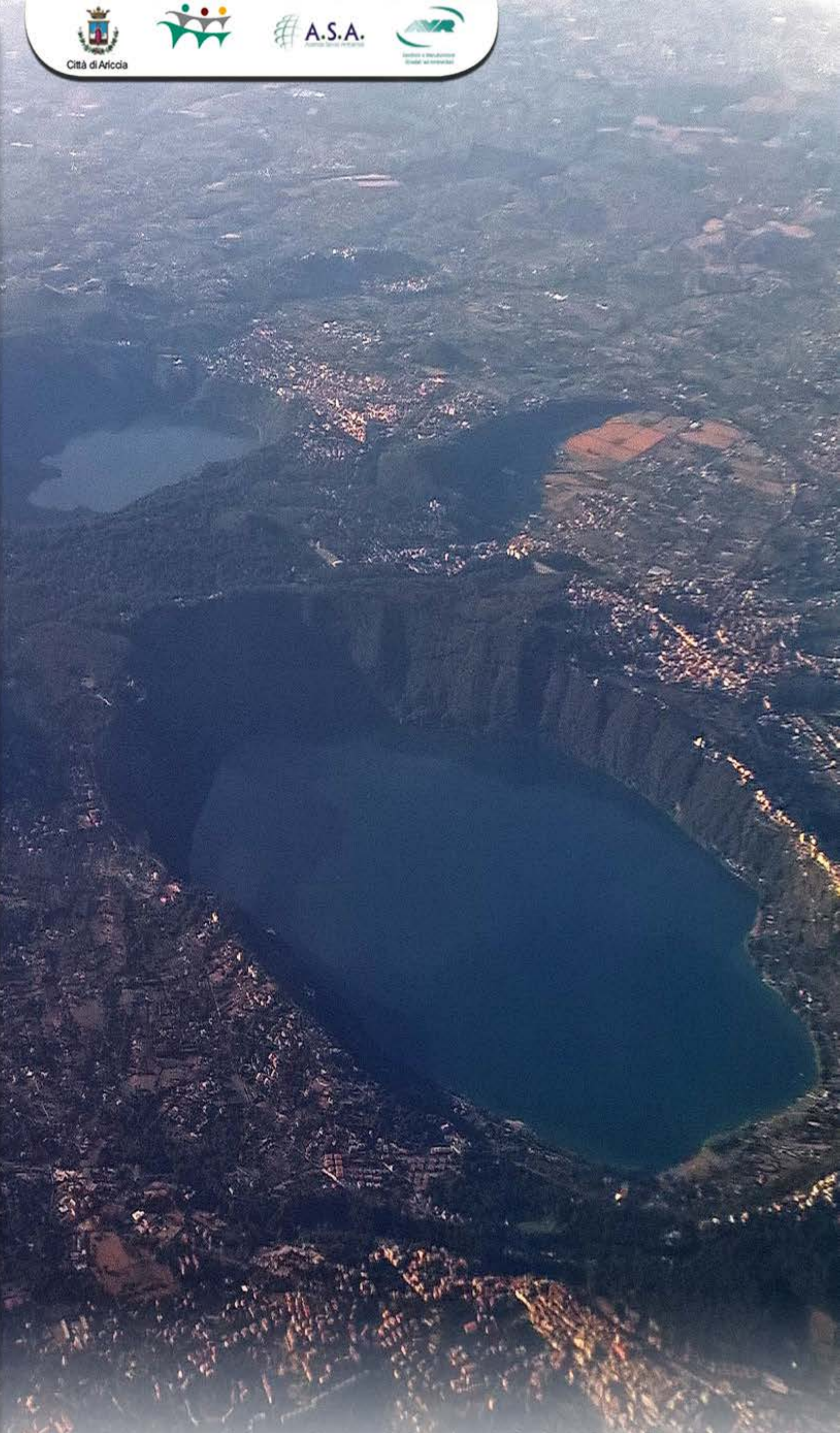
Veduta aerea dei Laghi dei Castelli Romani

Centro di raccolta comunale Via delle Cerquette (vicino Stadio) LUNEDI-GIOVEDI dalle 8.00 alle 13.00 e dalle 14.00 alle 16.00 MARTEDI-MERCOLEDI-VENERDI-SABATO dalle 8.00 alle 14.00 DOMENICA dalle 8.00 alle 12.00