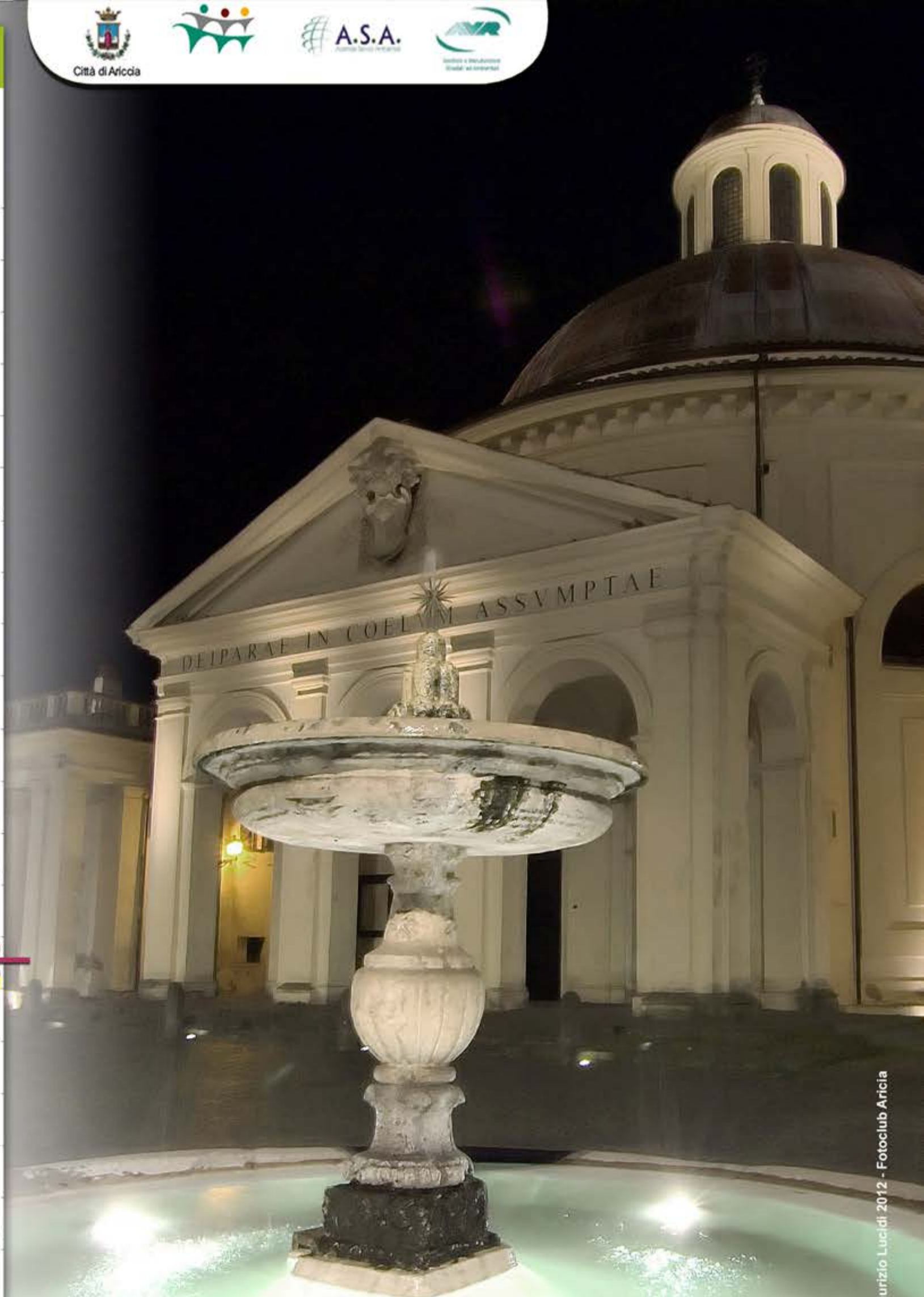
Piazza di Corte - Fontana del Bernini