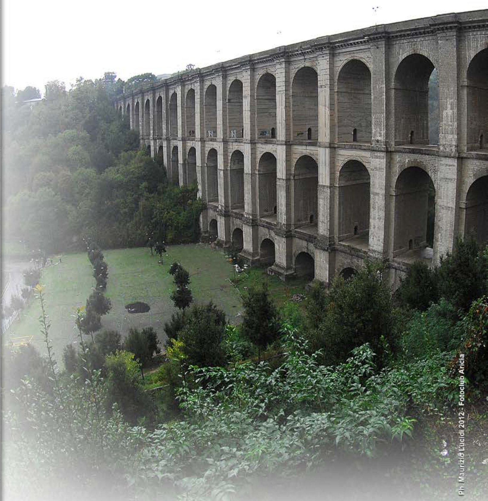
Ariccia Ponte Monumentale