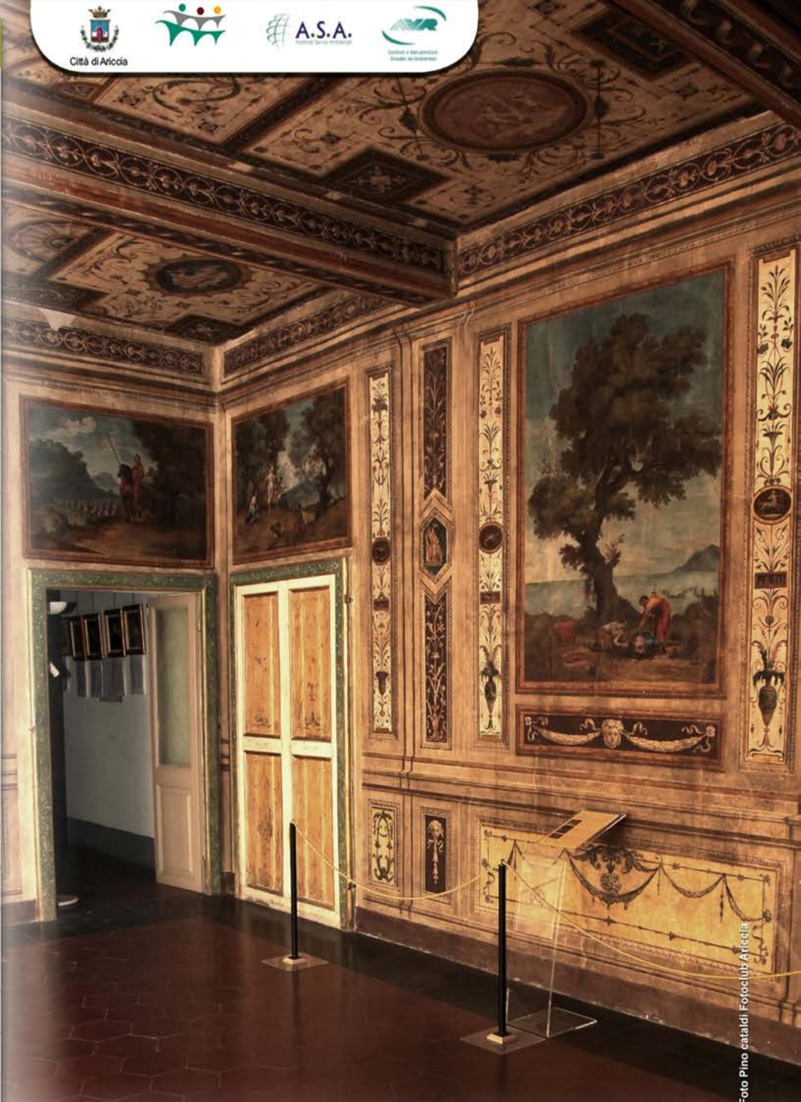
Locanda Martorelli Ariccia