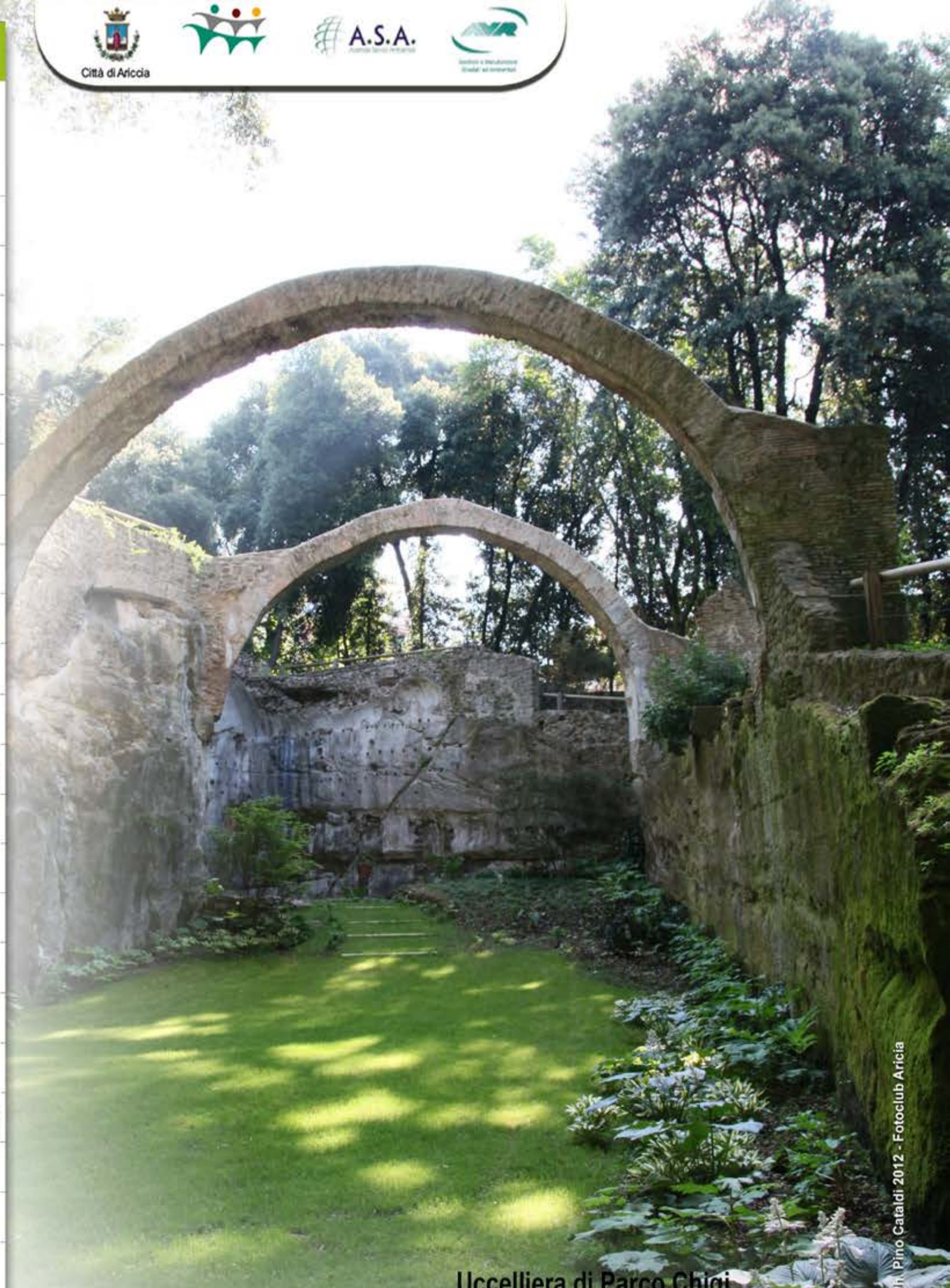
Uccelliera di Parco Chigi

Ph. Pino Cataldi 2012 - Fotoclub Ariccia