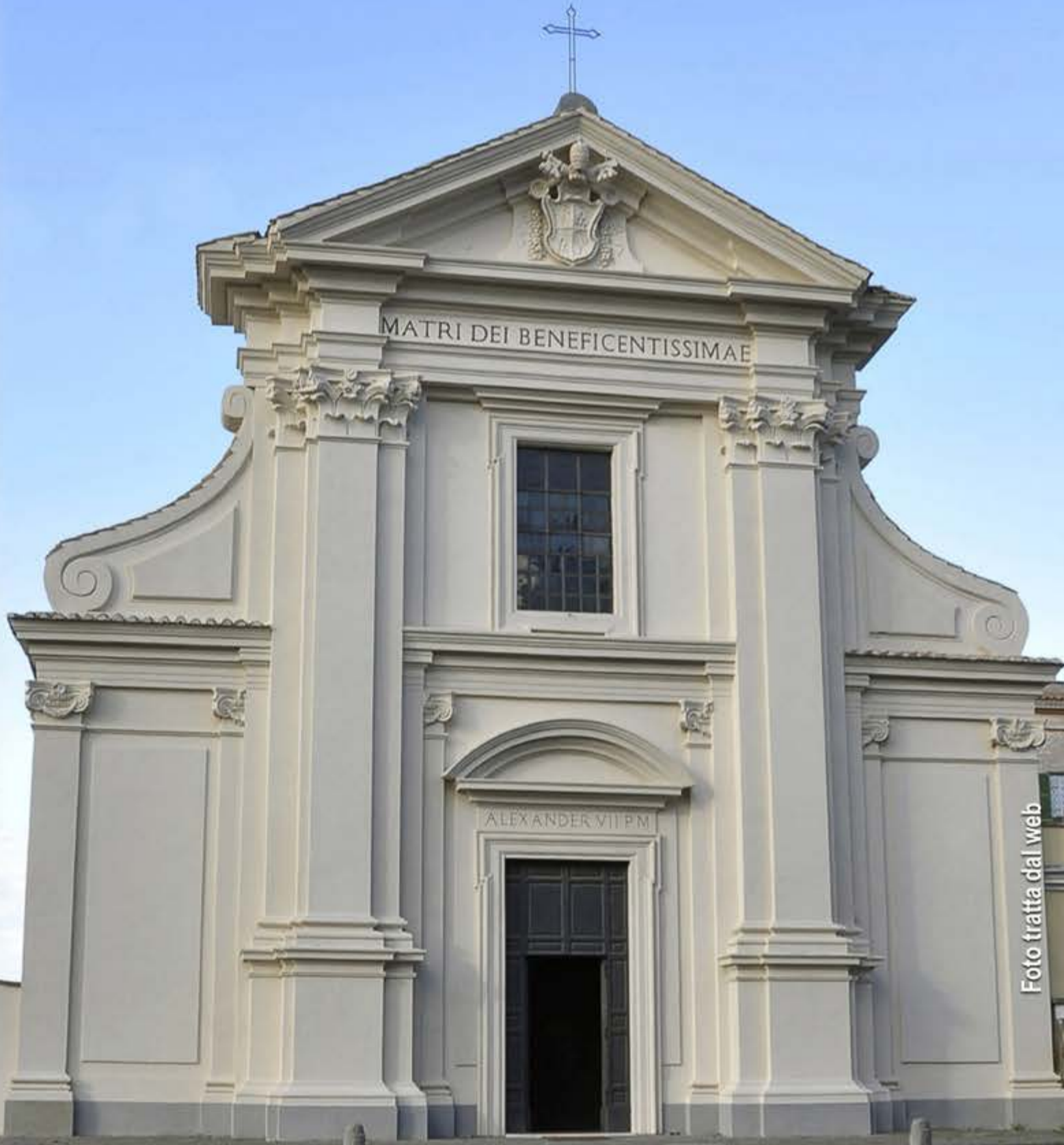
Santuario di Galloro, Ariccia